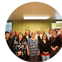
Seneca Warm Line